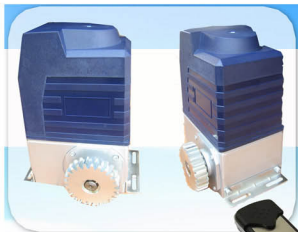
แบบฝาสูง